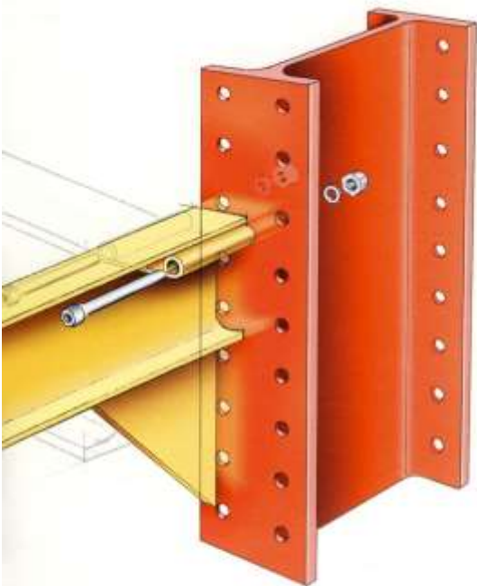
СВЪРЗВАНЕ МЕЖДУ КОНЗОЛА И КОЛОНА UNICANT

Връзката между конзолата и колоната се осъществява само с два високоустойчиви болтове – клас 12.9 съгласно DIN 912.