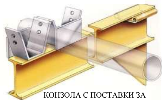
КОНЗОЛА С ПОСТАВКИ ЗА ТРЪБИ

Укрепващите връзки между колоните UNICANT са произведени от поцинкована стомана чрез прилагане на авангардни технологични разработки от METALSISTEM. Прилагането високопроизводителни технологии при производството на елементите UNICANT води до съществени предимства в качеството и ефективност на разходите.