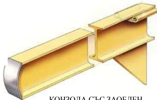
КОНЗОЛА СЪС ЗАОБЛЕН НАКРАЙНИК