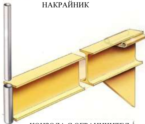
КОНЗОЛА С ОГРАНИЧИТЕЛ

Всички конструктивни елементи UNICANT са произведени от двойно Т-профил в границите от IPE 180 до IPE 300.