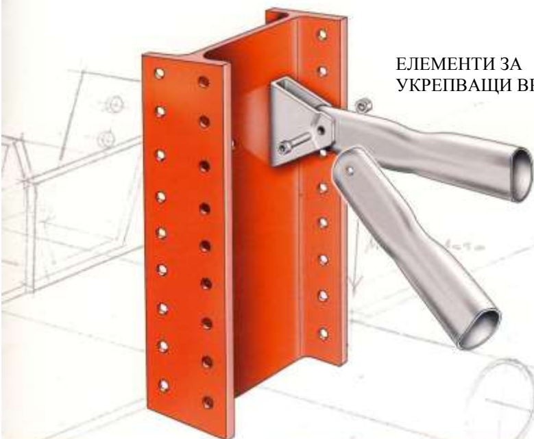
ЕЛЕМЕНТИ ЗА УКРЕПВАЩИ ВРЪЗКИ